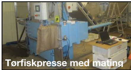
Tørfiskpresse med mating