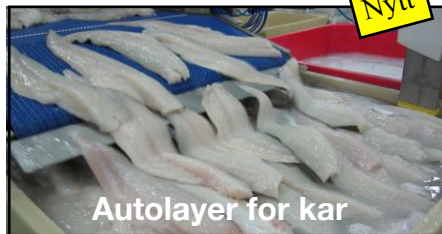
Autolayer for kar