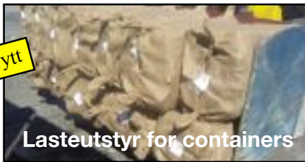
Lasteutstyr for containers