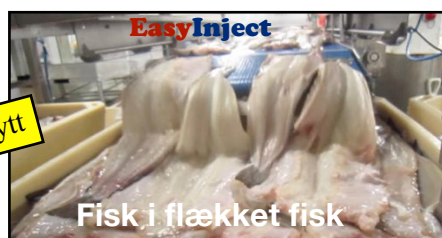
Fisk i flækket fisk