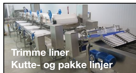
Trimme liner Kutte- og pakke linjer