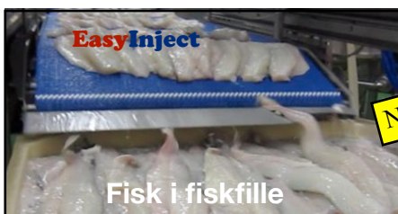
Fisk i fiskfille